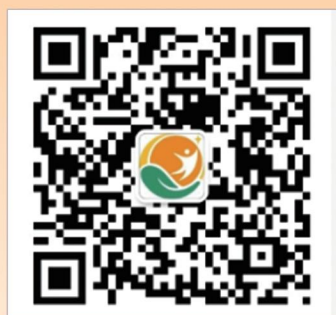
宜兴市特殊教育学校 微信公众号