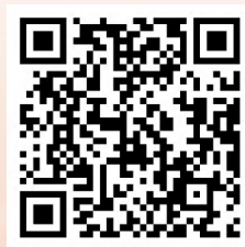
茶艺教学设计方案