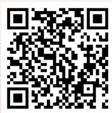
陶艺教学设计方案