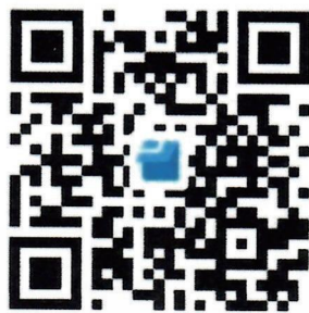
江苏省特殊教育年会报名表